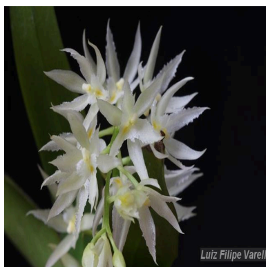
Figura 3: Warmingia eugenii Rchb.f.