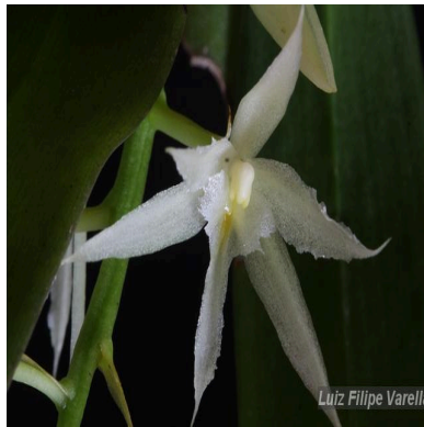
Figura 5: Warmingia eugenii Rchb.f.