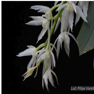
Figura 2: Warmingia eugenii Rchb.f.