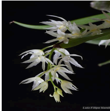
Figura 1: Warmingia eugenii Rchb.f.