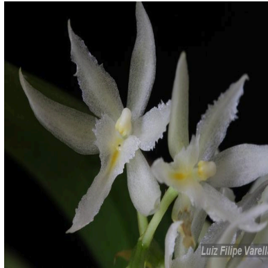
Figura 4: Warmingia eugenii Rchb.f.