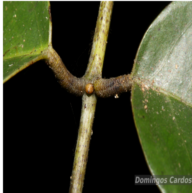
Figura 5: Vouacapoua americana Aubl.