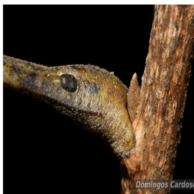
Figura 4: Vouacapoua americana Aubl.