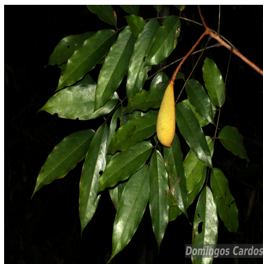
Figura 1: Vouacapoua americana Aubl.