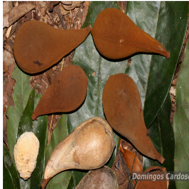
Figura 2: Vouacapoua americana Aubl.