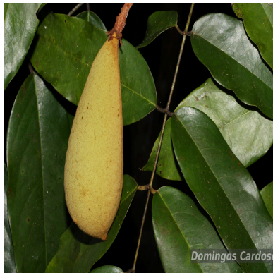
Figura 3: Vouacapoua americana Aubl.