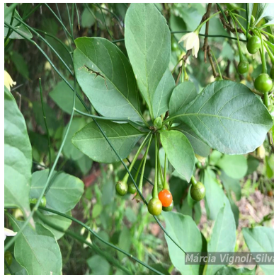
Figura 2: Vassobia breviflora (Sendtn.) Hunz.