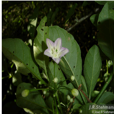
Figura 5: Vassobia breviflora (Sendtn.) Hunz.