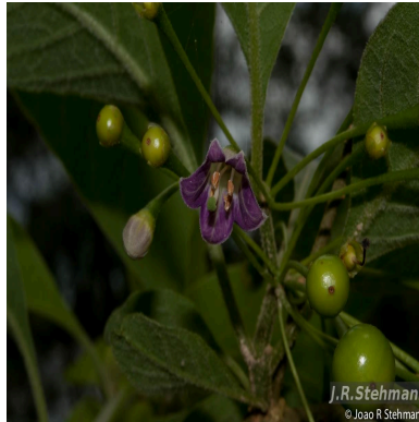
Figura 7: Vassobia breviflora (Sendtn.) Hunz.