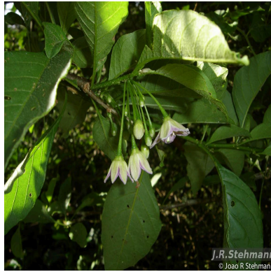
Figura 4: Vassobia breviflora (Sendtn.) Hunz.