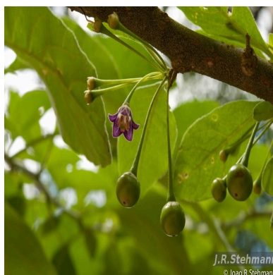
Figura 6: Vassobia breviflora (Sendtn.) Hunz.