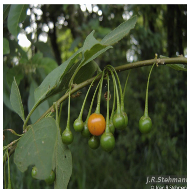
Figura 3: Vassobia breviflora (Sendtn.) Hunz.