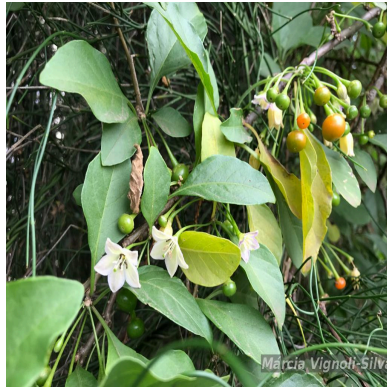
Figura 1: Vassobia breviflora (Sendtn.) Hunz.