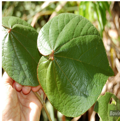
Figura 2: Talipariti pernambucense (Arruda) Bovini