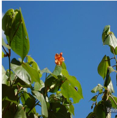
Figura 1: Talipariti pernambucense (Arruda) Bovini