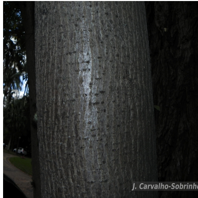
Figura 4: Spirotheca rivieri (Decne.) Ulbr.