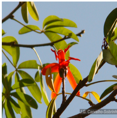
Figura 2: Spirotheca rivieri (Decne.) Ulbr.