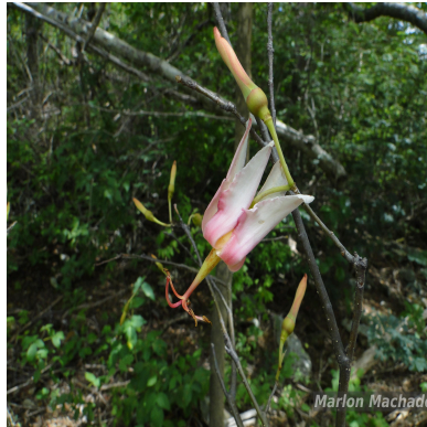
Figura 1: Spirotheca Ulbr.