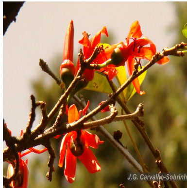
Figura 1: Spirotheca rivieri (Decne.) Ulbr.