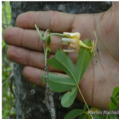
Figura 2: Spirotheca elegans Carv.-Sobr., M.Machado & L.P.Queiroz