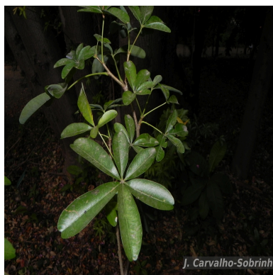
Figura 3: Spirotheca rivieri (Decne.) Ulbr.