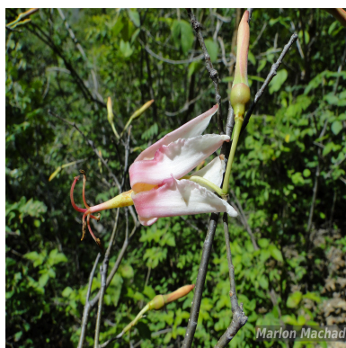
Figura 3: Spirotheca elegans Carv.-Sobr., M.Machado & L.P.Queiroz