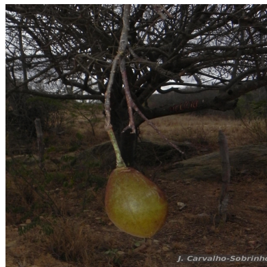
Figura 5: Spirotheca elegans Carv.-Sobr., M.Machado & L.P.Queiroz