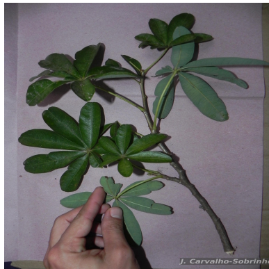
Figura 5: Spirotheca rivieri (Decne.) Ulbr.