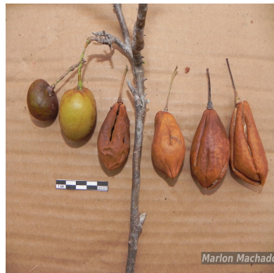
Figura 4: Spirotheca elegans Carv.-Sobr., M.Machado & L.P.Queiroz