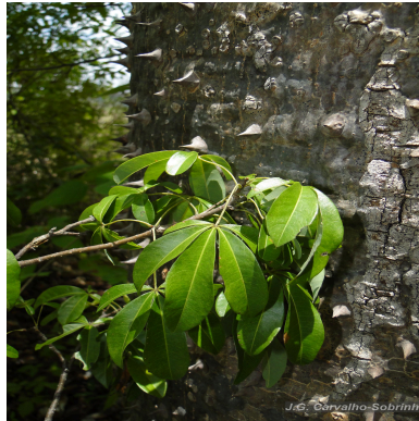
Figura 1: Spirotheca elegans Carv.-Sobr., M.Machado & L.P.Queiroz