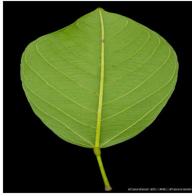
Figura 4: Scleronema micranthum (Ducke) Ducke