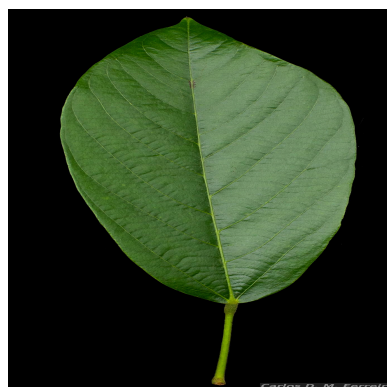
Figura 3: Scleronema micranthum (Ducke) Ducke