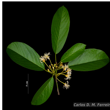
Figura 1: Scleronema micranthum (Ducke) Ducke