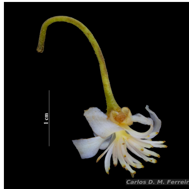
Figura 2: Scleronema micranthum (Ducke) Ducke