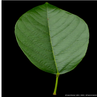
Figura 4: Scleronema Benth.