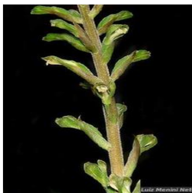
Figura 3: Sauroglossum elatum Lindl.