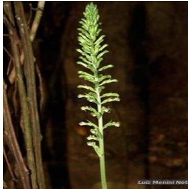
Figura 4: Sauroglossum elatum Lindl.