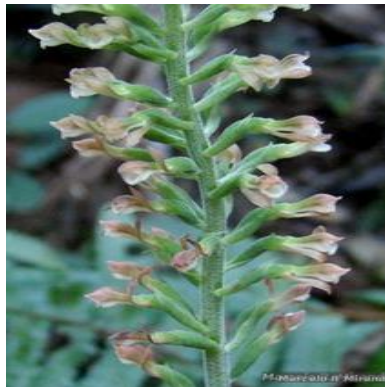
Figura 5: Sauroglossum elatum Lindl.