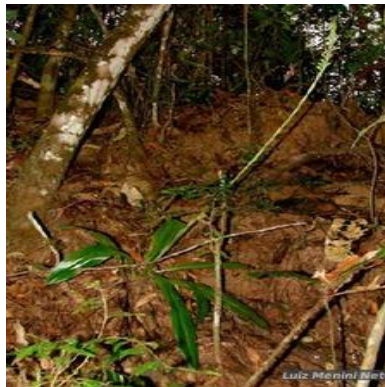
Figura 2: Sauroglossum elatum Lindl.