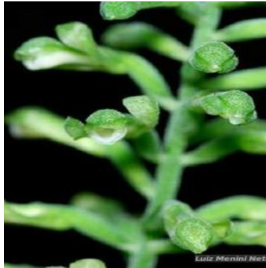
Figura 1: Sauroglossum elatum Lindl.