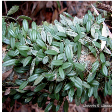
Figura 2: Sansonia bradei Chiron