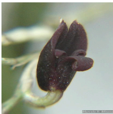
Figura 1: Sansonia bradei Chiron