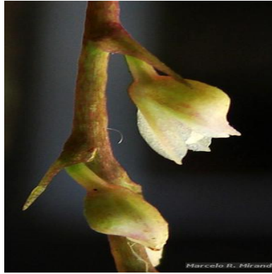
Figura 2: Sanderella discolor (Barb.Rodr.) Cogn.