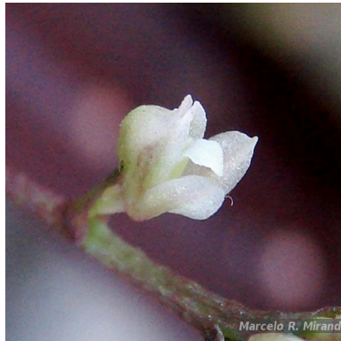
Figura 3: Sanderella discolor (Barb.Rodr.) Cogn.