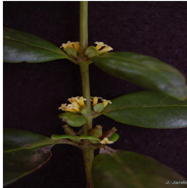
Figura 2: Salzmannia nitida DC.