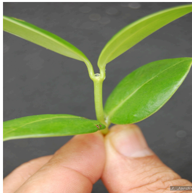
Figura 3: Salzmannia nitida DC.