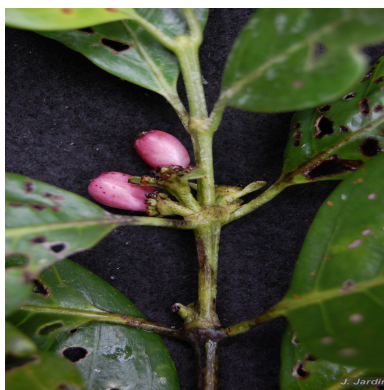
Figura 1: Salzmannia arborea J.G. Jardim