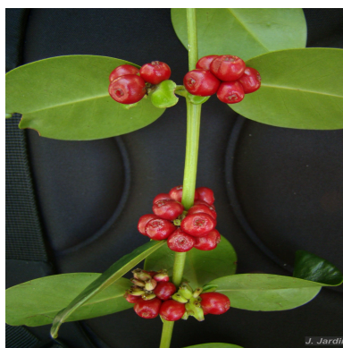
Figura 1: Salzmannia nitida DC.