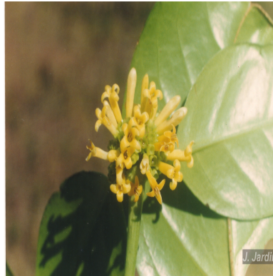
Figura 2: Salzmannia arborea J.G. Jardim