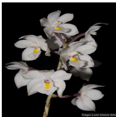
Figura 1: Otostylis brachystalix (Rchb.f.) Schltr.