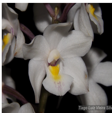
Figura 2: Otostylis brachystalix (Rchb.f.) Schltr.