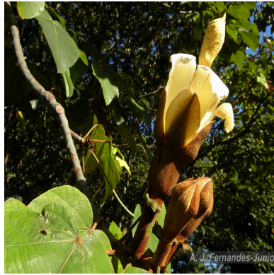
Figura 1: Ochroma pyramidale (Cav. ex Lam.) Urb.