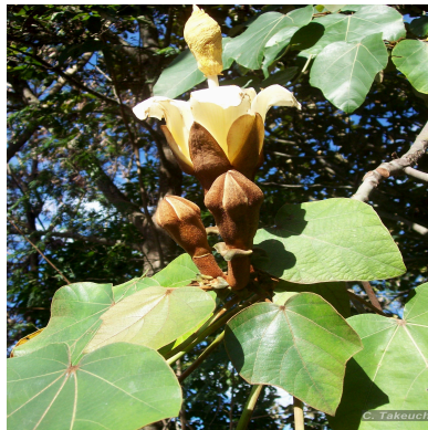
Figura 2: Ochroma pyramidale (Cav. ex Lam.) Urb.