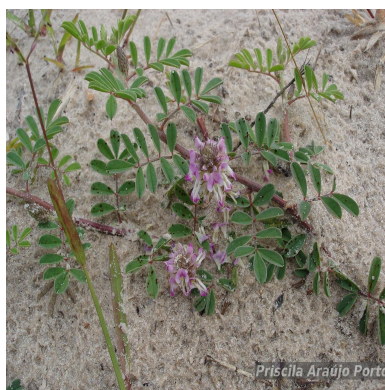
Figura 3: Indigofera sabulicola Benth.