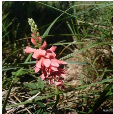
Figura 1: Indigofera campestris Bong. ex Benth.