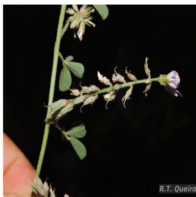
Figura 3: Indigofera microcarpa Desv.