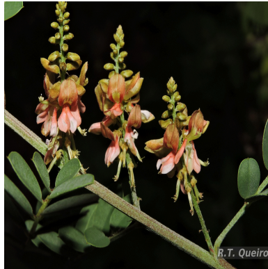
Figura 4: Indigofera suffruticosa Mill.