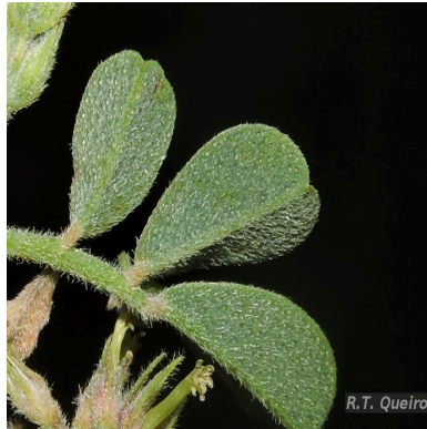
Figura 1: Indigofera microcarpa Desv.