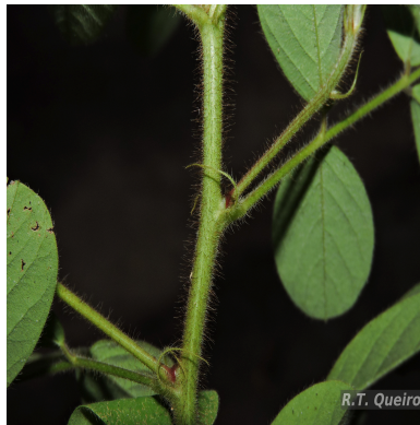
Figura 6: Indigofera hirsuta L.