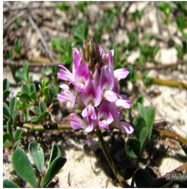
Figura 1: Indigofera sabulicola Benth.