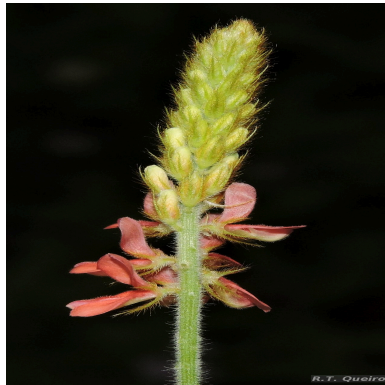
Figura 3: Indigofera hirsuta L.