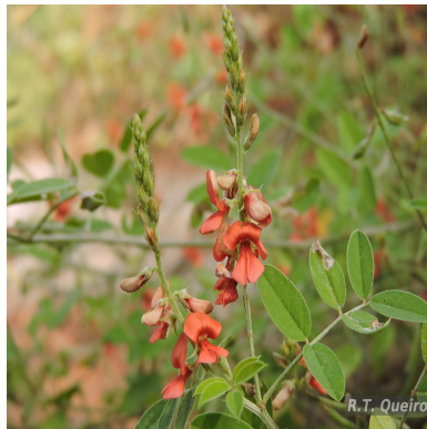
Figura 2: Indigofera blanchetiana Benth.