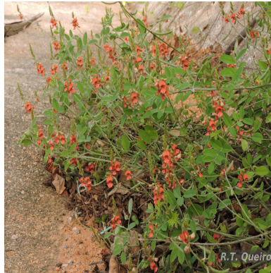
Figura 1: Indigofera blanchetiana Benth.