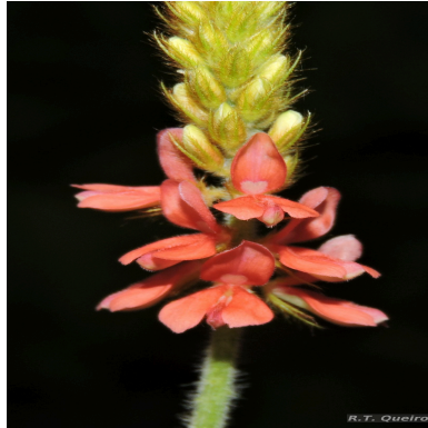
Figura 2: Indigofera hirsuta L.