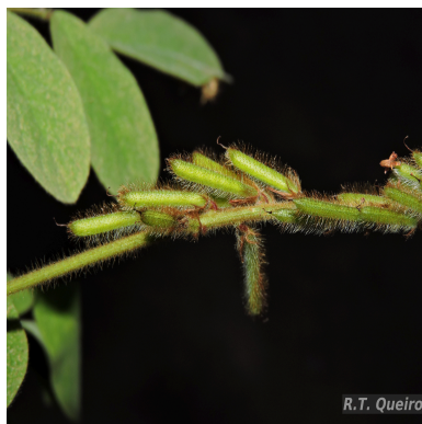
Figura 4: Indigofera hirsuta L.