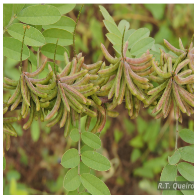
Figura 3: Indigofera suffruticosa Mill.