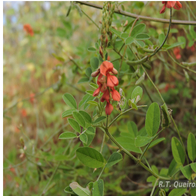
Figura 4: Indigofera blanchetiana Benth.