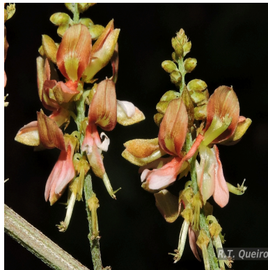
Figura 5: Indigofera suffruticosa Mill.