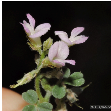
Figura 2: Indigofera microcarpa Desv.