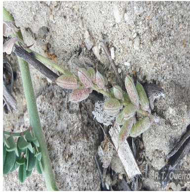
Figura 4: Indigofera microcarpa Desv.