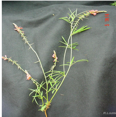
Figura 2: Indigofera asperifolia Bong. ex Benth.