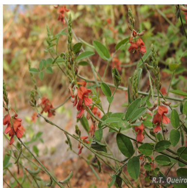
Figura 3: Indigofera blanchetiana Benth.