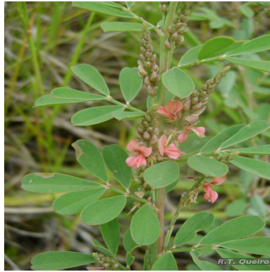
Figura 1: Indigofera lespedezioides Kunth