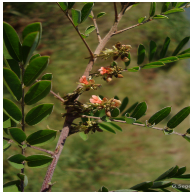
Figura 1: Indigofera suffruticosa Mill.