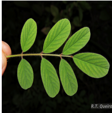
Figura 5: Indigofera hirsuta L.