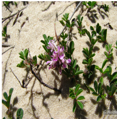
Figura 2: Indigofera sabulicola Benth.