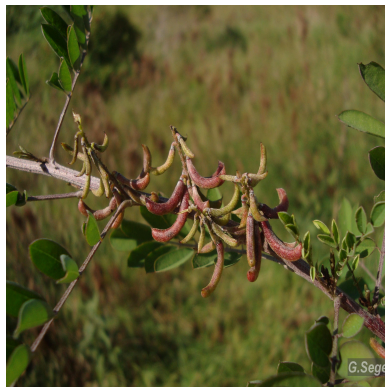
Figura 2: Indigofera suffruticosa Mill.