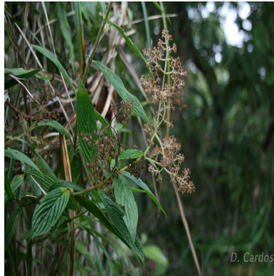
Figura 2: Emmeorhiza umbellata (Spreng.) K.Schum.