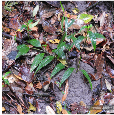
Figura 5: Emmeorhiza umbellata (Spreng.) K.Schum.