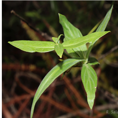
Figura 1: Emmeorhiza umbellata (Spreng.) K.Schum.