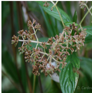
Figura 3: Emmeorhiza umbellata (Spreng.) K.Schum.