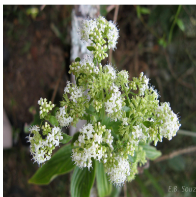
Figura 4: Emmeorhiza umbellata (Spreng.) K.Schum.