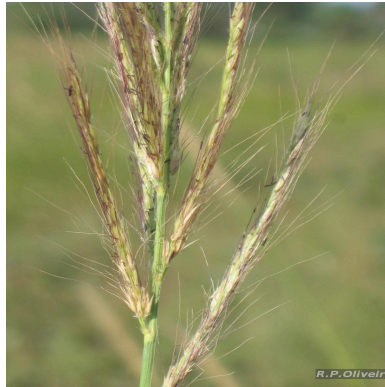
Figura 1: Chaetium festucoides Nees