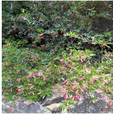
Figura 3: Augusta longifolia (Spreng.) Rehder