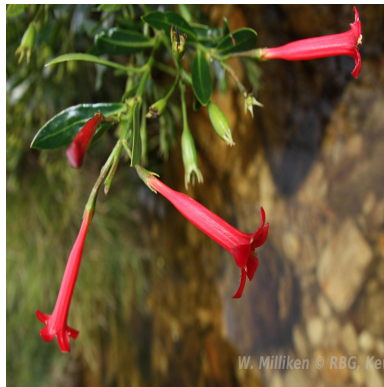
Figura 1: Augusta longifolia (Spreng.) Rehder