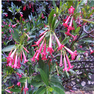
Figura 2: Augusta longifolia (Spreng.) Rehder